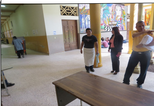
Decana observa el retiro de bienes

Como parte del proceso de aseo y descargo de bienes materiales y de oficina, la Unidad de Servicios Generales junto con el Comité de Seguridad y Salud Ocupacional, llevaron a cabo una jornada de limpieza en pasillos e instalaciones del Edificio Histórico de la Facultad de Jurisprudencia y Ciencias Sociales, a fin de mantener un ambiente limpio y saludable para los usuarios de la misma. Fueron dos jornadas de arduo trabajo de parte del personal de Servicios Generales, de manera que se han recuperado espacios para que los estudiantes puedan desarrollar sus tareas, así como tener otra opción para almorzar en las mesas rojas que están contiguo al Aula de Simulaciones.