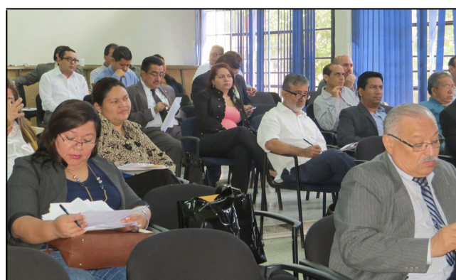
Docentes de esta Facultad

En ese sentido, dicha unidad tiene como funciones principales el desarrollo y seguimiento de la planificación académica para el Ciclo II 2016 el iniciará el próximo 25 de julio.