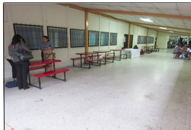
Pasillo frente al Aula de Simulaciones