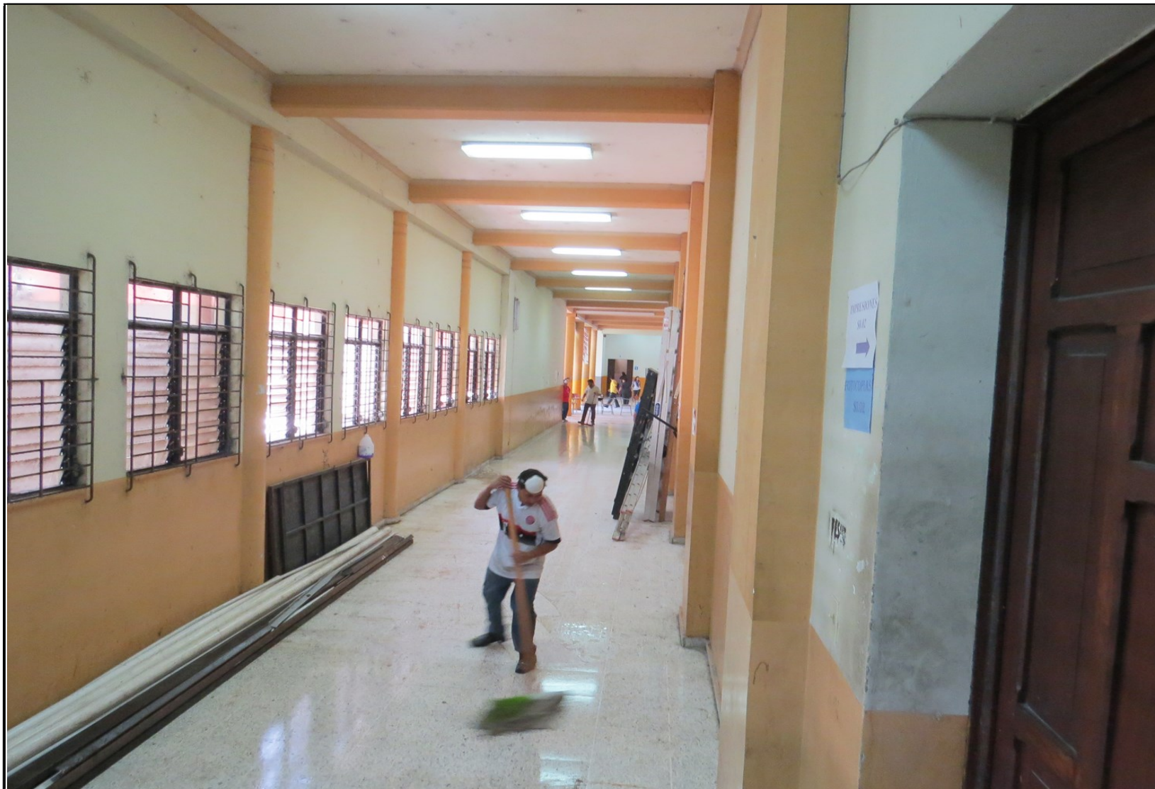
Personal de la Unidad de Servicios Generales ejecuta jornada de aseo y descargo de bienes materiales en el Edificio Histórico

Como parte del proceso de aseo y descargo de bienes materiales y de oficina, la Unidad de Servicios Generales junto con el Comité de Seguridad y Salud Ocupacional, llevaron a cabo una jornada de limpieza en pasillos e instalaciones del Edificio Histórico de la Facultad de Jurisprudencia y Ciencias Sociales, a fin de mantener un ambiente limpio y saludable para los usuarios de la misma. Fueron dos jornadas de arduo trabajo de parte del personal de Servicios Generales, de manera que se han recuperado espacios para que los estudiantes puedan desarrollar sus tareas, así como tener otra opción para almorzar en las mesas rojas que están contiguo al Aula de Simulaciones.