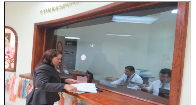
Decana entrega documentación en A.L.