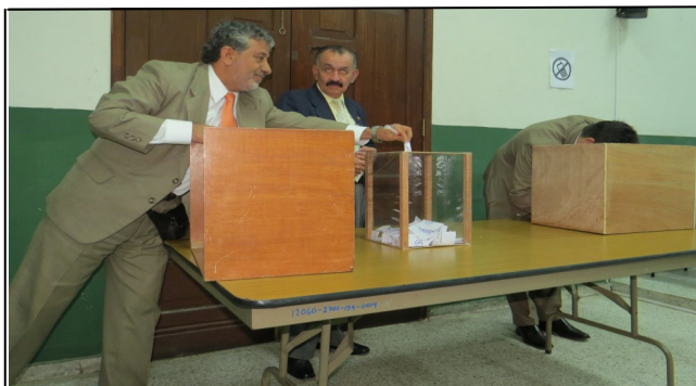
Votación de Abogados Docentes Unidad de Comunicaciones