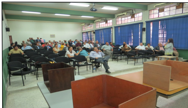
Asamblea de Abogados Docentes

En ese sentido, la Facultad de Jurisprudencia y Ciencias Sociales da cumplimiento al Artículo 176 de la Constitución de la República, y a los artículos 9,12,13 y 17 de la Ley del CNJ.