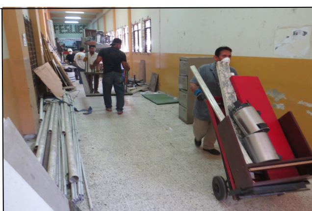
Personal retira bienes de pasillos